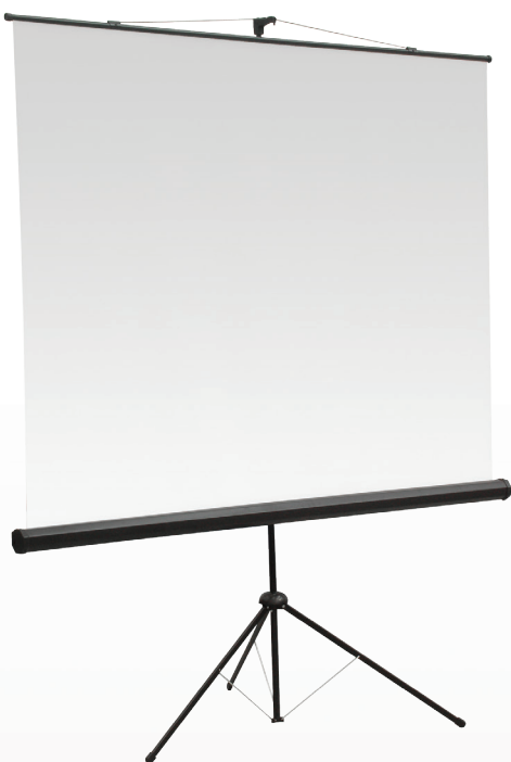
Sotto: sistema di inclinazione del telo di proiezione anti-keystone; maniglia con rilascio a scatto per alzare ed abbassare il telo